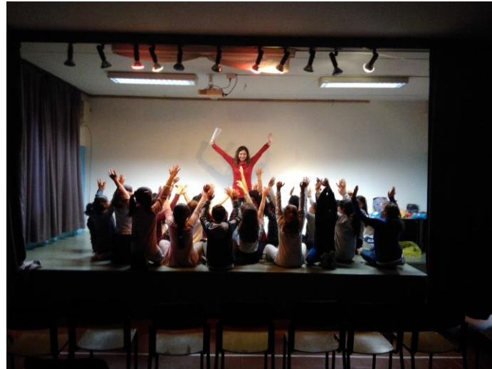
Foto di Laboratori ideati e condotti da Chiara Amplo Rella e Restituzioni Sceniche